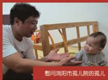
慰问浏阳市孤儿院的孤儿